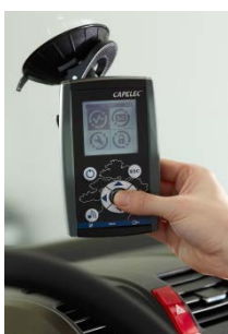
Option : Boîtier dual décéléromètre- pedomètre, sans fil