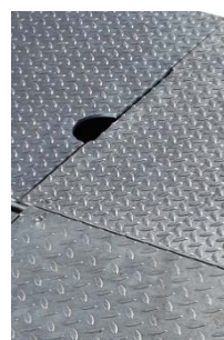
Options : Plaques de recouvrement Gabarit d'adaptation