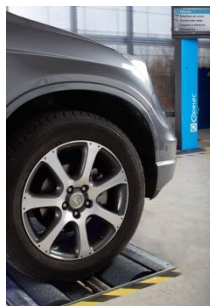
Variante : Blocage des rouleaux et démarrage progressif