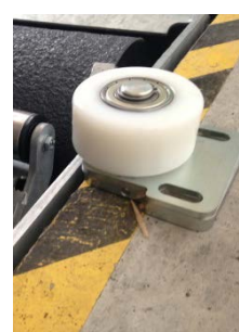
Option : Kit élargisseur