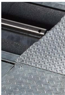
Rouleaux époxy en aluminium Châssis galvanisé